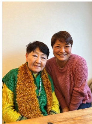
千葉景子元法務大臣と