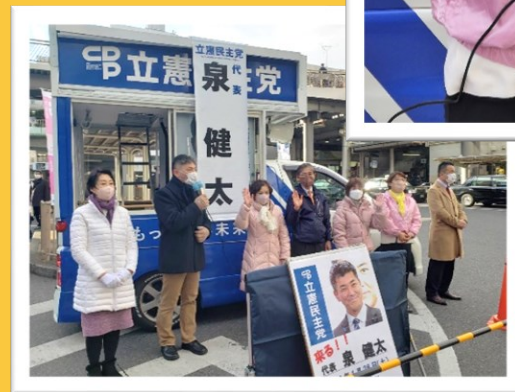
各級議員、候補予定者も街頭演説会に参加

「目の前の暗闇で絶望してはいけない」 「若い人に対する期待や希望は非常に大きなものになっている」 そのことを、若い人達に覚えていて欲しい、と。