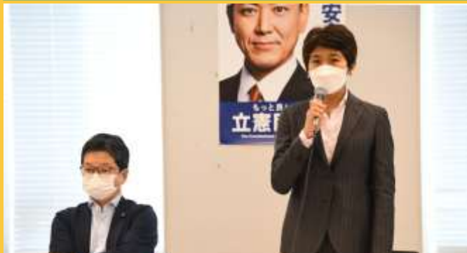
9月21日 旧統一教会被害対策本部・消費者部会合同会議 (党HPより) 左：石橋通宏事務局長 右：西村智奈美本部長

立憲民主党は7月21日、「旧統一教会等による被害等を調査・検証し、対策を立案する」ため「 旧統一教会被害対策本部 」を設置しました。本部長は西村智奈美幹事長(当時)、事務局長は石橋通宏参院議員が務めます。また、長年にわたりこの問題に取り組んできた有田芳生前参院議員が参与として加わりました。